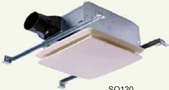
SQ120 (DC motor)

SQ120 : Grille en ABS Moteur DC Débit d'air (CFM at 0.10" S.P.) 120 Protection thermique, moteur lubrifié de façon permanente Approbations ETL-CETL, HVI, E-Star